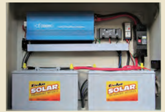
α1500盤内(用途に応じて特注対応)